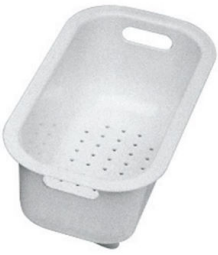
白瓜篱 8151 100